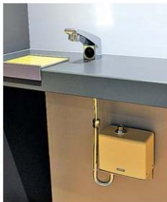
TOTOMIミュージアム所蔵の光電センサー内蔵自動水栓

認定されたのは、▽新晃SRD型エアディフューザ ▽ホーム分電函(BBK-3) ▽TOTOMIミュージアム所蔵の光電センサー内蔵