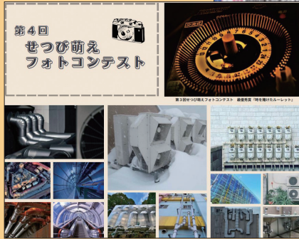
せつび萌えフォトコンテスト