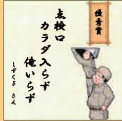
関東支部 川柳コンテスト