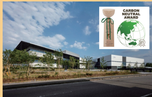
カーボンニュートラル賞