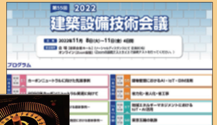
建築設備技術会議